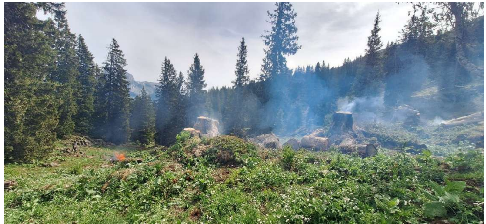
Skiclub, Brisizimmer, Sellamatt