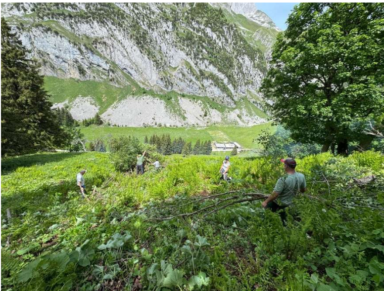
Bestösser, „Alp Tesel

Die Ortsgemeinde Gams bedankt sich herzlich bei allen Vereinen, Bestössern und weiteren Helfern für ihren wertvollen Einsatz. Diese Arbeiten leisten einen wichtigen Beitrag zum Unterhalt, zur Pflege und zum Erhalt unserer Alpen.