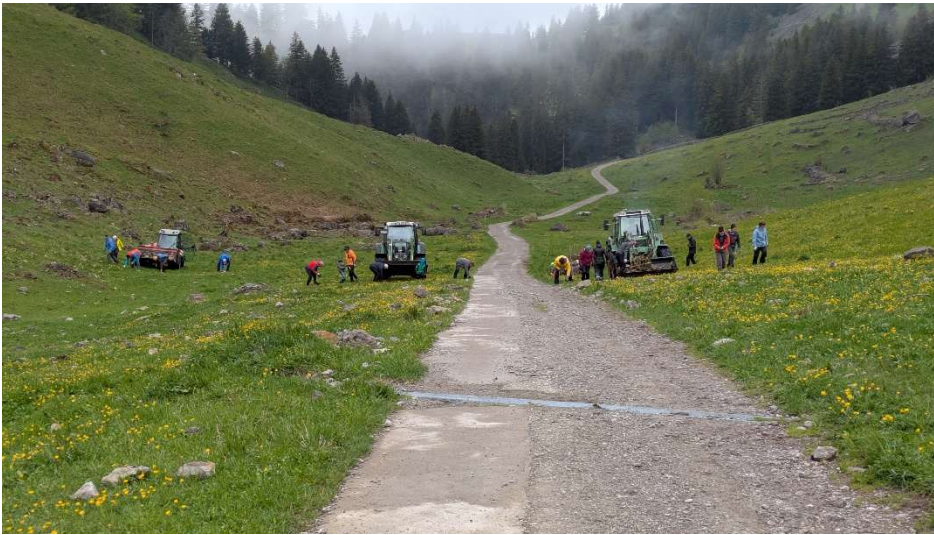
SAC, Alp Tesel