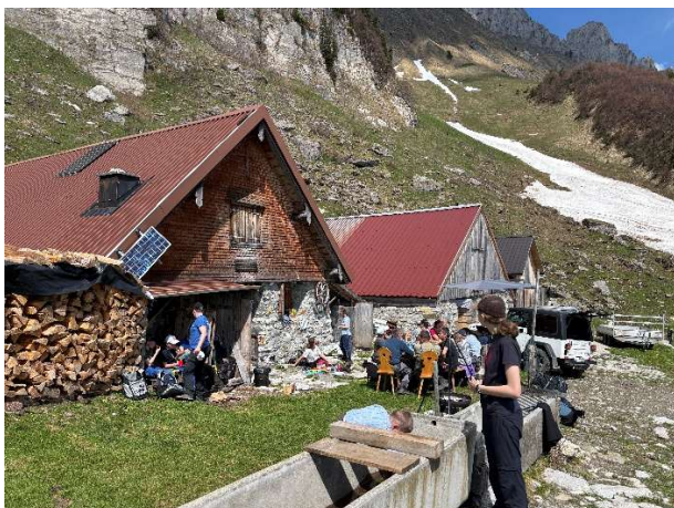
Trachtengruppe Kreuzberg, Alp Abendweid

Auf der Alp Tesel trafen sich zudem einige Bestösser, um die obligatorischen Fronstunden zu leisten. Neben Holz- und allgemeinen Aufräumarbeiten wurden dabei auch die letzten Überreste einer Lawine vom Frühling weggeräumt, sowie der Güllekasten geleert und der Güllemixer entfernt.